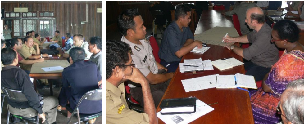
Gambar 5. Suasana Diskusi Kelompok

Untuk melakukan analisis stakeholder, masing-masing kelompok mendiskusikan siapa stakeholder dan peran mereka, kemudian hasil diskusi tersebut dirangkum menggunakan matrik analisis (Lihat Tabel 1).