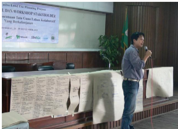
Gambar 6. Presentasi Kelompok

maupun kecil perlu dilihat pengaruhnya terhadap apa?. Kadang-kadang stakeholder berpengaruh terhadap suatu hal namun pada konteks yang berbeda mereka tidak punya pengaruh sama sekali. Tentunya pengaruh dan kepentingan tersebut harus diletakkan konteks terhadap tata guna lahan di kabupaten Kapuas Hulu.